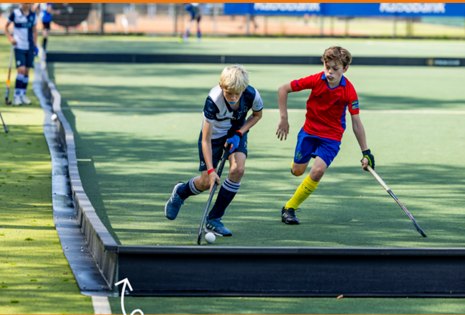
Boarding Hockey 5s

Naast het 'gewone' veldhockey worden er nog meer vormen van hockey in Nederland gespeeld. Hiernaast staan er een aantal soorten toegelicht.